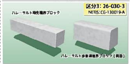
副題：凍害による劣化に対して優れた耐久性を有する環境(CO2抑制)配慮型歩車道境界ブロック