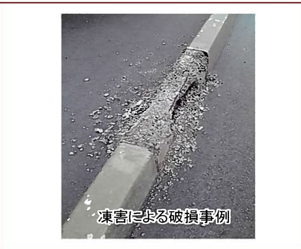
凍害による破損事例