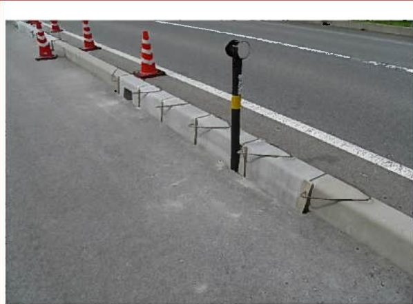
ハレーサルト歩車道境界ブロック 施工実績