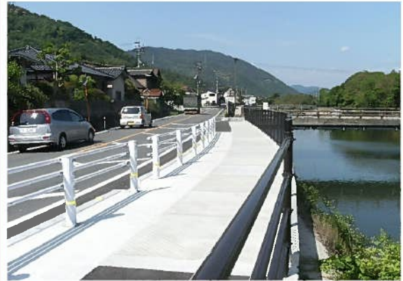
ハレーサルト張り出し歩道 施工実績

EPMA (電子線マイクロアナライザ) による 表面からの塩化物イオンの浸透深さと濃度解析写真 ( NaCl 濃度 : 10% 浸漬期間 : 365 日 )