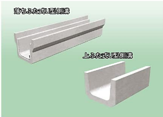
ハレーサルトU型側溝 イメージ