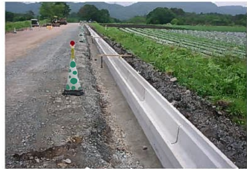
ハレーサルトJIS側溝 施工実績

EPMA (電子線マイクロアナライザ) による 表面からの塩化物イオンの浸透深さと濃度解析写真 ( NaCl 濃度 : 10% 浸漬期間 365 日 )